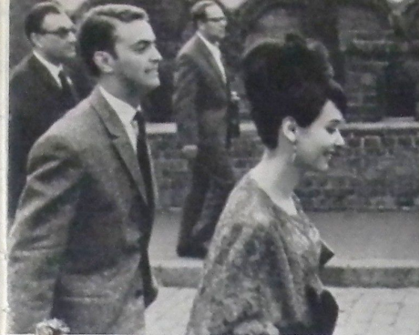
В Кремль, на просмотр...

ترحب بمشتركي المهرجان السينمائي الدولي الرائع في موسكو!