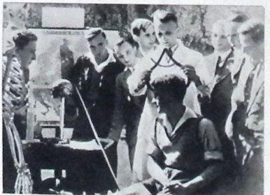
Кадры из фильма «Обыкновенный фашизм»

когда видишь, что на съезде свехсоюзных работников, где должны обсуждаться вопросы повышения зарплаты, почти нет людей в штатском, это производит большее впечатление, чем самый торжественный военский парад.