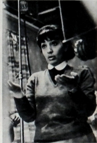
Режиссер Татьяна Лиознова на съемке