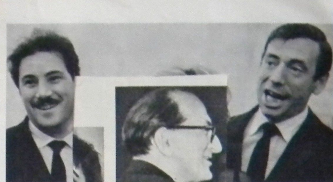
Песенка о парижки на бульварах Москва