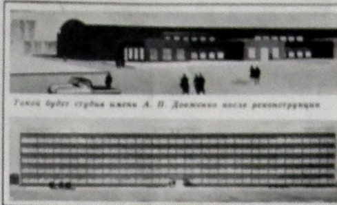
Такой будет студия имени А. П. Доженко после реконструкции