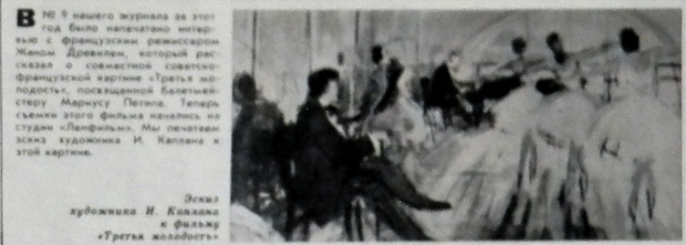
Съемка художника И. Каллана к фильму «Третья холодность»