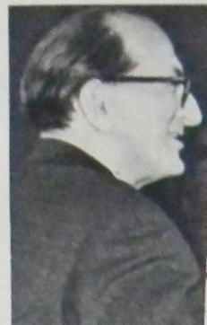
Лицо кинолюбит Григорий Чухрай