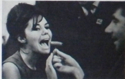
Русская музыка — это вещь...