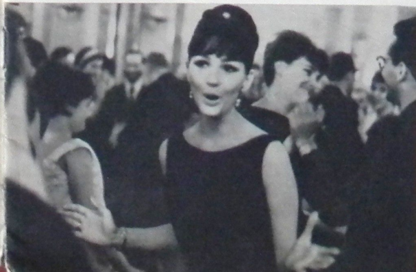
Когда вокруг — друзья...